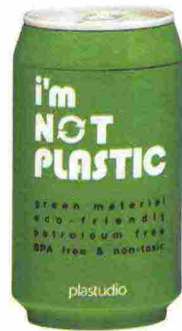
Bottiglia termica biodegradabile a forma di lattina, Bitossi Home su Amazon.it (€ 13).