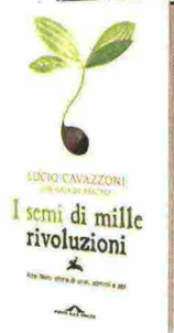
Storia del consorzio bio Alce Nero, I semi di mille rivoluzioni di Lucio Cavazzoni (Ponte alle Grazie, pagg. 144, € 13,50).