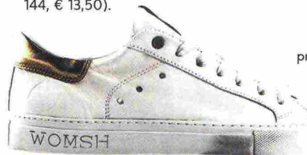
Le Womsh sono sneakers a impatto zero: le emissioni di CO 2 generate dal ciclo produttivo sono compensate dalla creazione di foreste (€ 145).