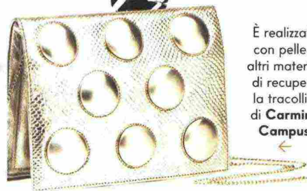
È realizzata con pelle e altri materiali di recupero la tracollina di Carmina Campus .