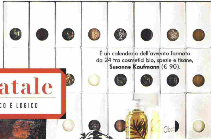
È un calendario dell'avvento formato da 24 tra cosmetici bio, spezie e tisane, Susanne Kaufmann (€ 90).